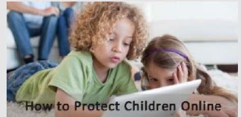
How to Protect Children Online Como Proteger a los Hijos en el Internet